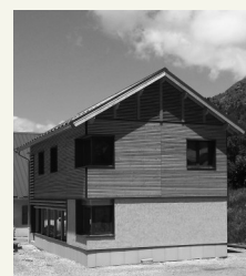
Nouveaux bureaux des Services Techniques à St-Etienne

Une augmentation nécessaire du marché a été votée portant le marché à 319 691.71 € HT.